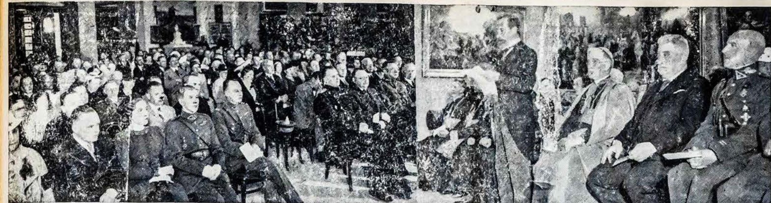
Siemet Lietuvoje iškilmingai buvo paminėtos krikščionybės Lietuvoje 550 metų įvedimo sukaktuvės. Šiame atvaizde matome tų sukaktuvių paminėjimą Karo Muziejuje. Dešinėje sako kalbą Respublikos Prezidentas Antanas Smetona. Jam iš kairės sėdi arkivyskupas metropolitas Juozapas Skvireckas, seimo pirmininkas inž. K. Šakenis, krašto apsaugos ministras kariuomenės vadas brig. gen. St. Raštikis ir kt. Kairėje — iškilmingojo posėdžio dalyviai.

reikalais kreipkitės reikalais kreipkitės reikalais kreipkitės