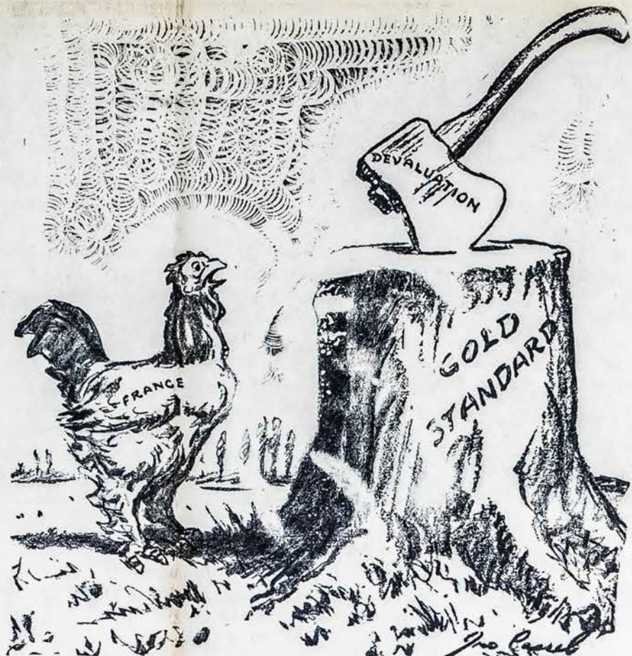
Štai koku būdu Prancuzijos frankas devaliuojamas

Reikia nepamiršti, kad per pastarą dešimtmetį social-fašistai ugdė nacionalizmo ambicijas, įkaitino savo minias, daugino gyventojus, o padaugėjus burnų ir pilvų skaičių, reikia daugiau duonos. Ekonominis ir karo strategos atžvilgiu, vokiečiams ir italams nebelieka išeities kaip tikitai pradėti karą dabar, nes