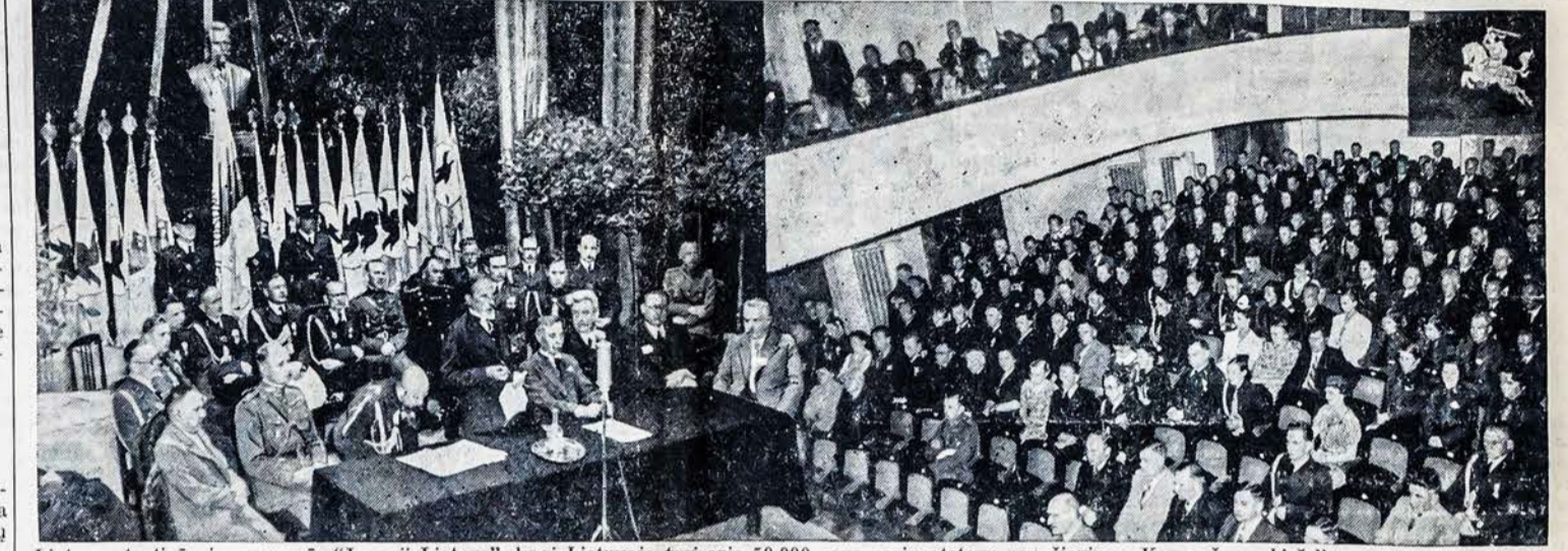
Lietuvos tautinės jaunuomenės "Jaunoji Lietuva", kuri Lietuvoje turi apie 50.000 savo narių atstovų suvažiavimas Kaune š. m. birželio m. 12 d. Dešinėje — Sąjungos garbės narys ir globėjas Respublikos Prezidentas Antanas Smetona sako kalbą.

No. 28-tas Telefonas Dial 5-1094 WORCESTER, MASS., 9-tą LIEPOS (JULY) 1938 M. Kaina 5 Centai VOL. XX