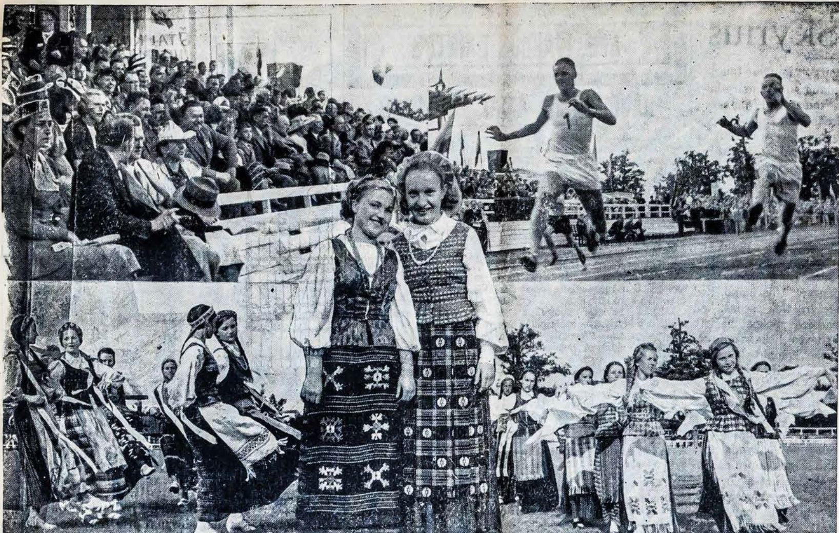
Vaidžiai iš Lietuvos gimnazijų moksleivių Olimpijados kuri įvyko Kaune, š. m. birželio 11, 12, 13 ir 14 dienomis. Moksleivių Olimpijada yra įžanga į didžiąją Lietuvių tautinę Olimpijadą, kuri netrukus įvyks Kaune, dalyvaujant viso pasaulio lietuviams.