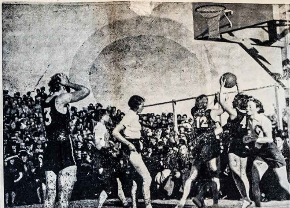
Lietuvos valstybinė moterų krepšinio komanda (apsirengusi baltais marškiniais ir tamsiomis kelnaitėmis) š. m. gegužės 22 d. Kaune sėkmingai nugalėjusi Estijos valstybinę moterų krepšinio komandą rezultatu 15:7 Lietuvos naudai ir gegužės 28 d. Rygoje nugalėjusi Latvijos valstybinę moterų krepšinio komandą rezultatu 25:7 Lietuvos naudai. Šiame atvaizde matome tarpvalstybines moterų krepšinio rungtynes Lietuva-Estija Kaune š. m. gegužės 22 d.