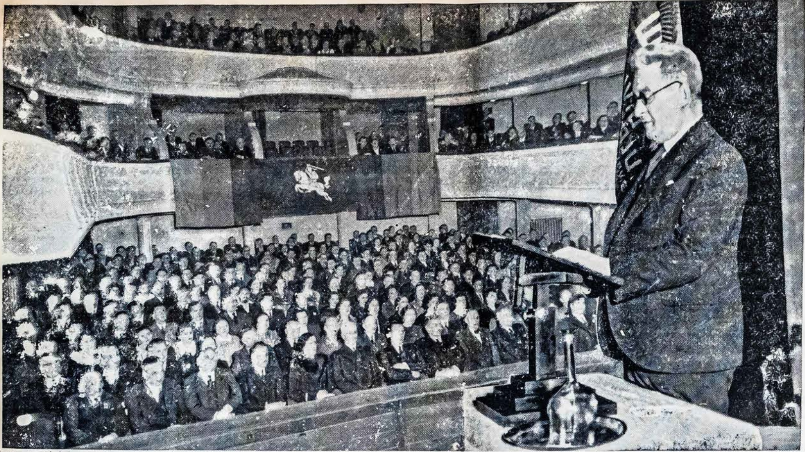
Kauno tautininkai naujosios Konstitucijos įsigaliojimo proga Valstybės Teatre surengė iškilmingą posėdį. Jame išsamiai paskaitą apie naująją Konstituciją skaitė Seimo pirmininkas inž. K. Šakenis. Šiame atvaizde matome jį beskaitantį paskaitą.