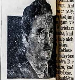
GERB. I. N. DEMY... "Per pereitais 20 metų..."