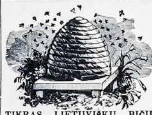
TIKRAS LIETUVIŠKŲ BICIŲ MEDUS