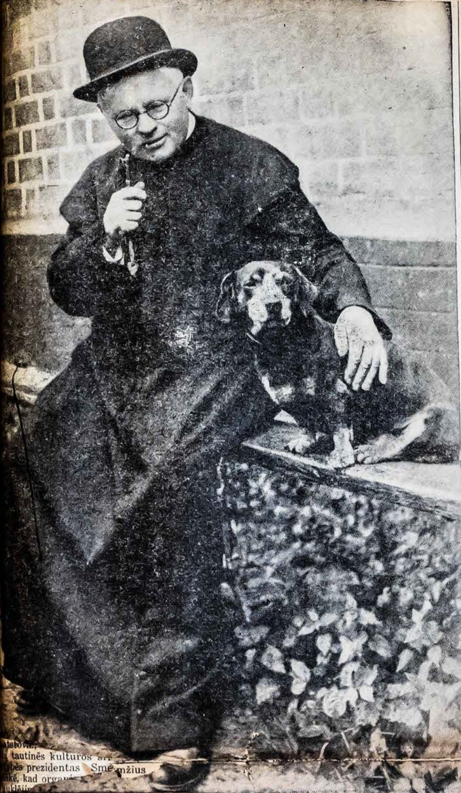
Dr. Juozas Tumas Vaižgantas, vienas iš žymiausių Lietuvos rašytojų ir veikėjų. Nuo jo mirties š. m. balandžio 29 d. sukako penkeri metai.