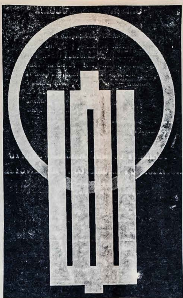
Pirmosios Lietuvos Tautinės Olimprijados ženklas