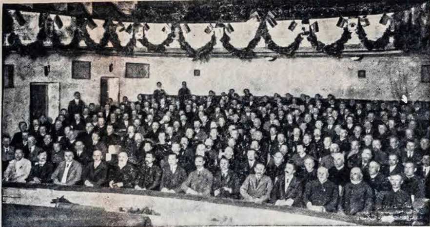
1917 m. rugsėjo 18-22 d. Vilniaus konferencijos dalyviai. Ši konferencija išrinko Lietuvos Tarybą, kuri paskelbė Lietuvos nepriklausomybę.

Kaip mes šiandien gerai žinome, tokių dievų net iš viso nėra. Žydai taip pat turėjo Velykų šventes, kurias švėsdavo pavasarį. Kaip Evangelijos mums paduoda, žydu Velykų metu buvęs nukryžiuotas Kristus. Žydai savo Velykas taip pat švėsdavo