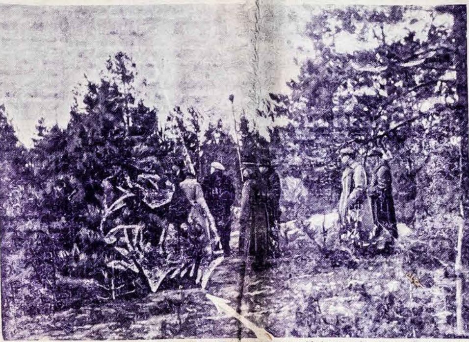
Ivykio vieta prie administracijos linijos, ties Trašnykų kaimu, Alytaus apskr., kur įvyko kovo 11 d. incidentas — susišaudymas tarp Lenkijos ir Lietuvos pasienio sargybinių. Per šį susišaudymą buvo pašautas vienas lenkų sargybinis, kuris vėliau mirė. Vieta, kur buvo pašautas lenkų sargybinis pažymėta strėle. Ji yra 17 metrų į Lietuvos pusę nuo matomos sienos gairės.