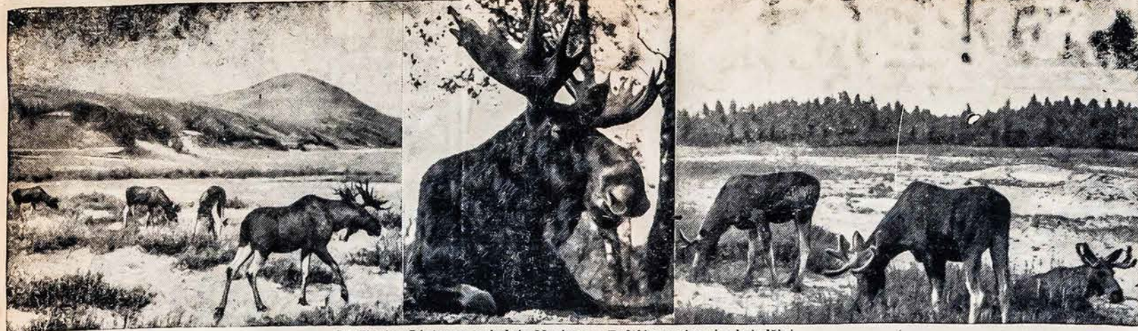
Gražiosios Lietuvos vaizdai: Neringos, Baltijos pajuryje, briedžiai