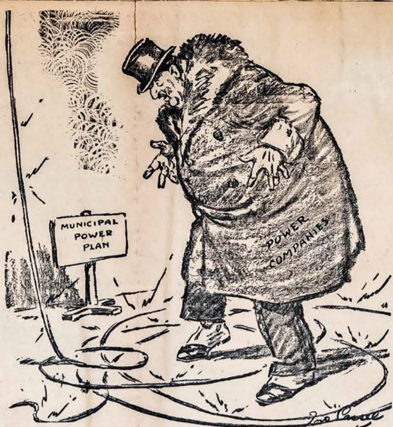
Trustas, kuris priešinasi F. D. R. Naujajai Dalybai

Dabar kaip tik laikas mums visiems remti Lietuvos imo Fondo darbą. O Lietuvos Vyriausybė tegul ieško- talkininkų, kad į businčius Lenkų ultimatumus ji ristų ne tik pildyti Lenkijos militaristų užgaidas, kad ji galėtų sykiu ir pareikšt savo nepasitenkinimą nkų ponų saivališkumu.