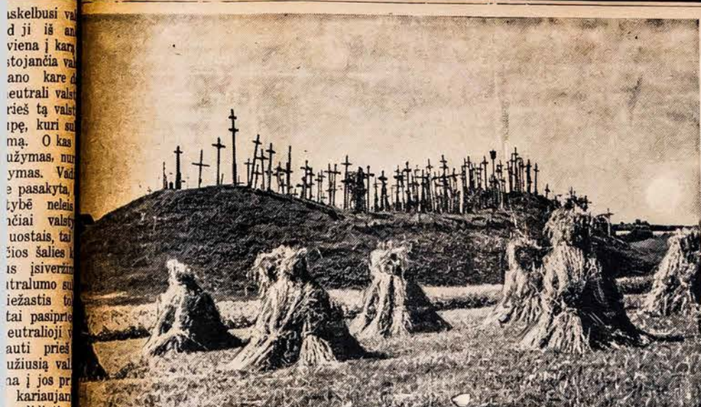
Lietuva. Kryžių kalnas ties Meškuičiais, Sialūių apskrity. Čia buvę rusų sušaudyti ir pa- keli 1863 metų sukilėliai. Jiems žmonės slapta pastatė pirmuosius kryžius. Paskui nuolat statomi nauji kryžiai, kaip Lietuvos kančių simboliai, ir tokiu būdu susidarė šis Kryžių kal- nas, kuris tebėra ir dabar.